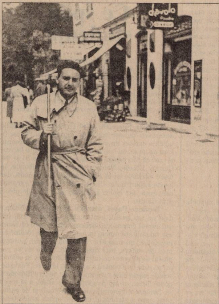
Nicolae MANOLESCU critic și istoric literar