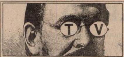
(totul de vînzare)

Nici nu se uscaser bine cerneala pe actul de investire, că proaspătul ministru al Reformei, binecunoscutul jurnalist Ilie Șerbănescu era deja prezent la „Milionarii de la miezul nopții”. Ca să ce? Vedetă, cum se zice acum, pentru a se spune totul și nimic și pentru a se amesteca și bruaia cât mai bine lucrurile, vedetă, așadar, a micului ecran, de stirpe rară (cel puțin la noi), de intelectual aplecat asupra concretului actualității, Ilie Șerbănescu nu avea ce exprima la Antena 1 mai mult sau altceva decît a exprimat, de ani buni de zile, la Pro TV, în disparuță, acum, emisiune „Rătăciți în tranziție”. De ce s-a dus, totuși, imediat după numire, la televiziune (nu contează care), din moment ce nu e un necunoscut, deci nu avea nevoie de mediatizare, iar ca ministru, la ora aceea, practic nu exista încă? Ca să alimenteze disputa pe tema să dintre Cristian Tudor Popescu și Marius Tucă? Ca să permită televiziunii să existe, să emită? Mister!